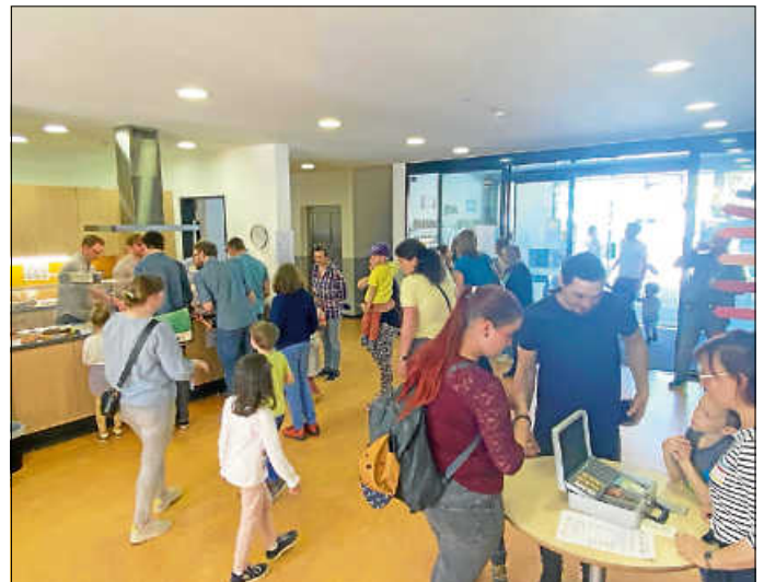
Für die Verpflegung sorgte der Elternbeirat.

Damit an diesem Tag auch niemand verhungern musste, sorgte der Elternbeirat für ein reichhaltiges Kuchenbuffet, Kaffee und andere Getränke natürlich inklusive.