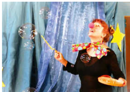
Ein Clown entdeckt die Welt.

Mittwoch, 08.05. – 20.00 Uhr – Eintritt frei, Spende erbeten