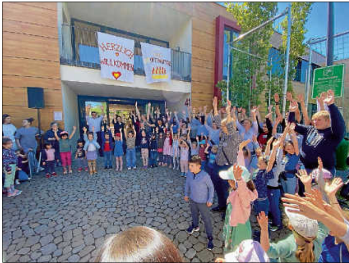
Mit reichlich Schwung startete der Tag der offenen Türe im Kinderhaus Hutwiesen.

Den Startschuss gaben dabei natürlich die Kinder selbst. Gekonnt und mit einem schwunghaften Lied hießen sie die zahlreich gekommenen kleinen und großen Besucher nicht nur musikalisch in ihrem Kinderhaus Hutwiesen willkommen.