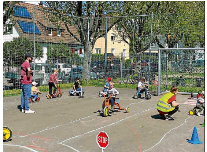
Zahlreiche Angebote ließen keine Langeweile aufkommen.

Und wer zwischendurch mal etwas Entspannung und ruhigere Augenblicke suchte, konnte dies bei Lichterspielen oder auch in einem Lichtertunnel tun.