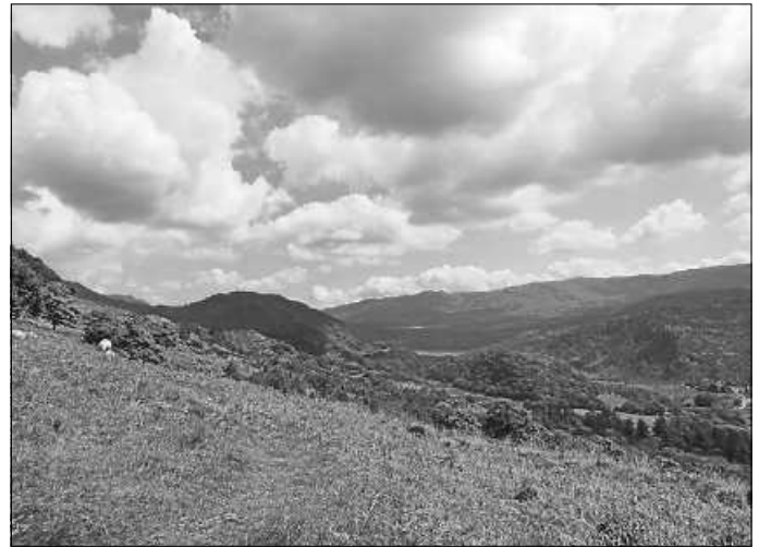
Raum für gute Gedanken: der Snowdonia National Park in Wales

Höhepunkt des Projekts ist eine Reise in den Osterferien 2025 (14. – 20. April) nach Nordwales/UK, um bei gemeinnütziger Landarbeit etwas für den Klimaschutz zu tun und gleichzeitig die eigene Persönlichkeit weiterzuentwickeln.