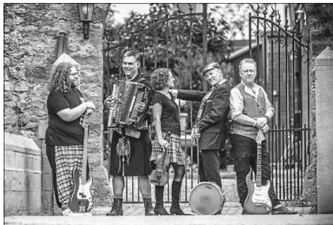
Die Band Aurelia spielt bei den Highlandgames

Die Band „Aurelia“ präsentiert am Highlandgames-Samstag, den 28. September, Irish- and Scottish Folkrock von 16 bis 18 Uhr. Das ist ein Mix aus Jigs, Reels, Slides und Polkas, die zum Mitwippen und Tanzen anregen. Begleitet wird die Band von der Tanzgruppe „Tamburin“, die Klein und Groß zum Mittanzen einlädt. Ein lustiger Nachmittag ist garantiert.