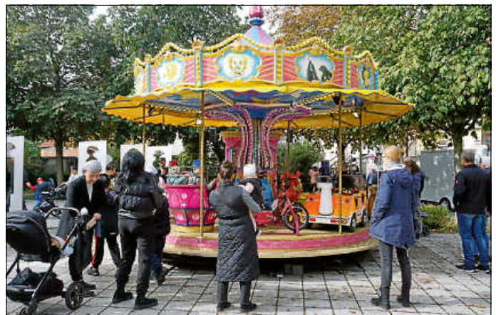
Vergnügungspark für Kinder auf dem Wilhelmsplatz

Dem allem noch nicht genug luden auch die Asperger Wengerter wieder zu ihren berühmten Schmankerln und Asperger Weinen in die Kelter ein sowie ab 13.00 Uhr dann auch die Asperger Geschäftswelt zum verkaufsoffenen Sonntag.