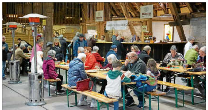
Die Wengerter hatten in die Kelter eingeladen.

Die Stadtverwaltung bedankt sich bei Beteiligten und bei allen Helfern vor und hinter den Kulissen, bei den Mitarbeitern des städtischen Bauhofes, die wieder einmal nahezu rund um die Uhr im Einsatz waren oder auch dem Ortsverein des Deutschen Roten Kreuzes.