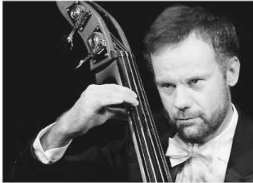
Der Kontrabass.

Mittwoch, 16.10. – 20.00 Uhr – Eintritt: € 8,-