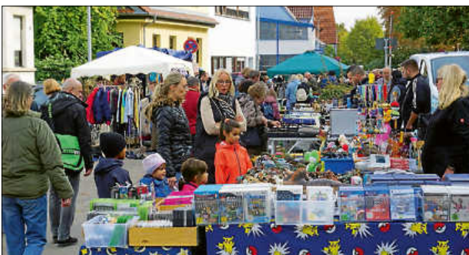
In der Seestraße gab es auch wieder einen Flohmarkt.

Dem allem noch nicht genug luden auch die Asperger Wengerter wieder zu ihren berühmten Schmankerln und Asperger Weinen in die Kelter ein sowie ab 13.00 Uhr dann auch die Asperger Geschäftswelt zum verkaufsoffenen Sonntag.