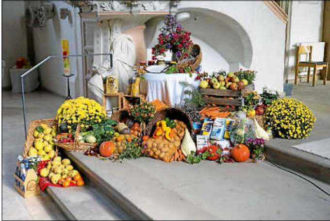
Erntedank in der Michaelskirche

Begonnen hat der Tag traditionell mit den Erntedankgottesdiensten der Kirchengemeinden. Diese luden zu ihren Festgottesdiensten in die besonders geschmückten Gotteshäuser ein.