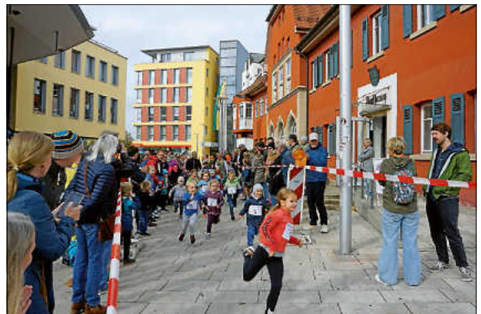
Rund um das Rathaus fand auch wieder der Kirbelauf statt.