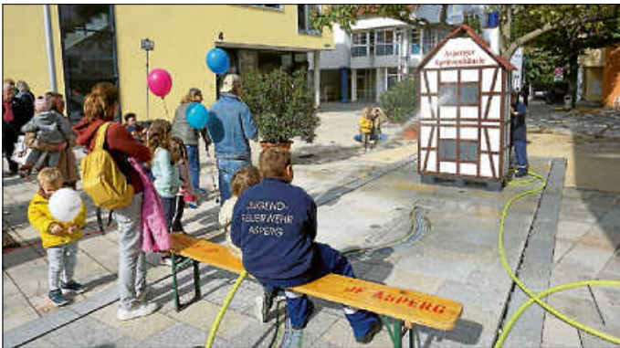
Bei der Kinderkirbe durfte aber vor allem das Spritzenhäuschen der Jugendfeuerwehr nicht fehlen.