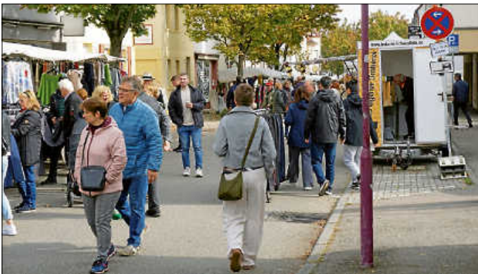
Kirbemarkt in der Bahnhofstraße

Auf dem Weg zum Flohmarkt in der Wilhelmstraße und der Seestraße sowie zum Vergnügungspark für Kinder auf dem Wilhelmsplatz konnten die Besucher auf dem Kirbemarkt in der Bahnhofstraße an vielen Marktständen Süßes, Salziges, Leckeres und Waren aller Art probieren und kaufen.