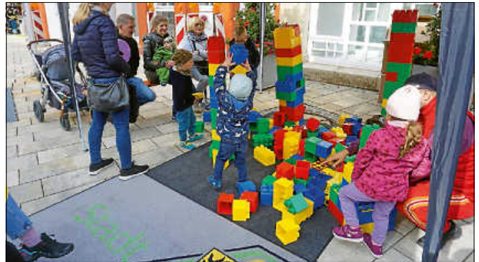
Ebenso konnten bei der Kinderkirbe mit Riesenlegobausteinen besonders phantasievolle Bauwerke errichtet werden.

Auf dem Weg zum Flohmarkt in der Wilhelmstraße und der Seestraße sowie zum Vergnügungspark für Kinder auf dem Wilhelmsplatz konnten die Besucher auf dem Kirbemarkt in der Bahnhofstraße an vielen Marktständen Süßes, Salziges, Leckeres und Waren aller Art probieren und kaufen.