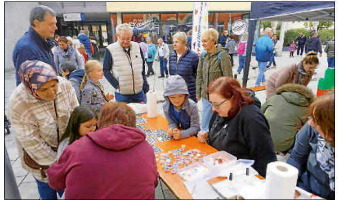
Beim Stand der Stadtbücherei wurden Glitzertattoos gemalt.