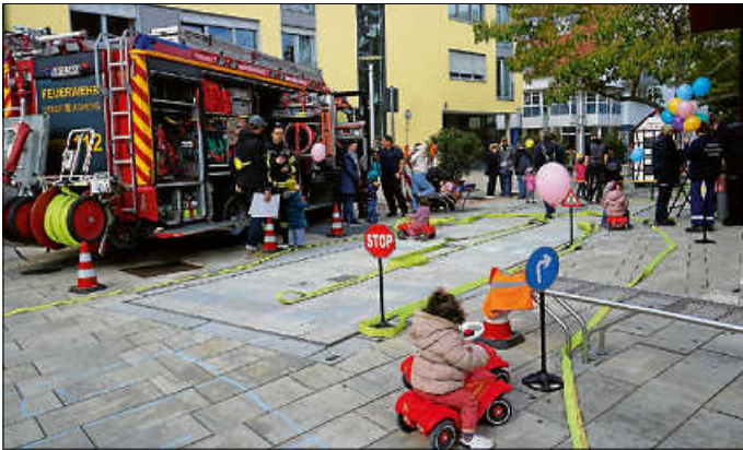
Kinderkirbe auf dem Marktplatz mit dem Bobby-Car-Parcours der Jugendfeuerwehr