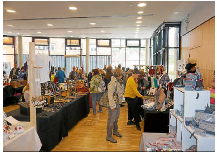
Hobbykunstmarkt im Keltensaal

Der Hobbykunstmarkt im Keltensaal lockte mit zahlreichem Kunsthandwerk. Allerlei Schönes und Nützliches konnte von den vielen Besuchern erworben werden. Der DRK-Ortsverein bewirtete mit Kaffee und Kuchen. Reißender Absatz war dabei garantiert.