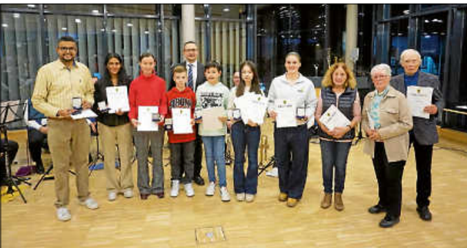
Beim Ehrenamtsabend konnten auch wieder zahlreiche erfolgreiche Sportlerinnen und Sportler ausgezeichnet werden.