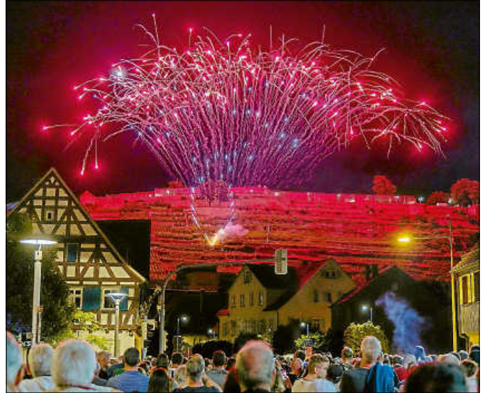
Krönender Abschluss des Stadtfestes war wieder das Feuerwerk.