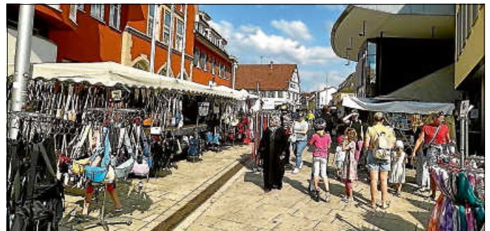
Am 24. Juli fand in der Stadtmitte wieder der Krämermarkt statt.

Am 24. Juli fand wieder der beliebte Krämermarkt auf dem Marktplatz rund um das Asperger Rathaus statt. Geboten wurde den Besuchern ein gut gemischtes Angebot. Bekleidung, Tee, Gewürze, Lederwaren, Schmuck, Dekoration, Handarbeiten und diverse andere schöne Dinge gab es auf dem Marktplatz an diesem Tag zu entdecken. Zahlreiche Asperger nutzten die Gelegenheit für einen Bummel durch die Marktstände.