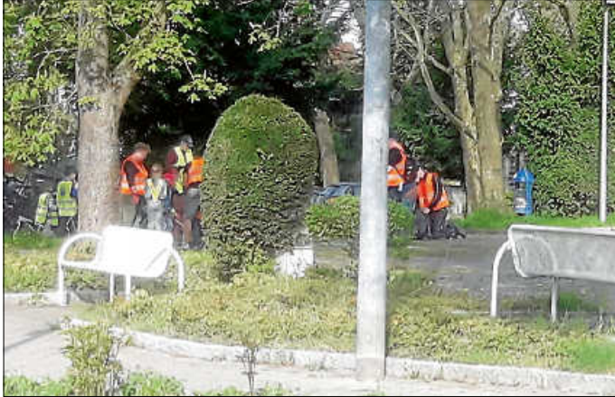
Bei der 13. Auflage der Asperger Stadtputzete wurden wieder 1,2 Tonnen Müll eingesammelt.

Am Samstag, den 6. April, fand bei herrlichstem Wetter die 13. Asperger Stadtputzete statt. Ca. 180 fleißige Helferinnen und Helfer der Asperger Kindergärten, Schulen, Vereine, Kirchen, Organisationen und Privatpersonen waren im Einsatz. Gegen 9.30 Uhr machten sich die Sammelgruppen in ihren zugeteilten Bezirken an die Arbeit. Es wurden insgesamt ca. 1,2 Tonnen Müll eingesammelt. Um 12:00 Uhr gab es dann im Haus der Senioren einen kleinen Imbiss für alle Teilnehmer.