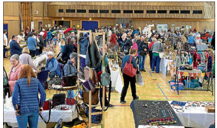
Am 10. März fand in der Stadthalle der Asperger Frühlingmarkt statt.

Am 10. März füllten zahlreiche Besucherinnen und Besucher die Stadthalle. Nachdem der erste Asperger Frühlingmarkt 2023 bereits sehr großen Anklang bei den Besuchern und Ausstellern fand, wurde er im vergangenen Jahr aufgrund der hohen Nachfrage sogar in die Stadthalle verlegt. Über 40 Aussteller präsentierten sich und ihr Kunsthandwerk an schön dekorierten Ständen. Handgefertigte Taschen, Kleidung für Babys und Kleinkinder, Drechselarbeiten, Schmuck, Deko-Artikel aus verschiedenen Materialien, Aquarelle und vieles mehr fanden großen Anklang bei den Käufern.