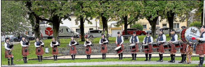
Schottische Klänge verbreiteten wieder die Heidelberg and District Pipes and Drums.

Aktionsreich ging es bereits am Samstag zu Beginn mit einer Rätsellallye der Stadtbücherei los. Beim anschließenden Teamwettbewerb der Highlandjunioren konnten sich Teams der Asperger Vereine und Jugendgruppen miteinander messen. Anklang fand im Anschluss auch die Live-Musik der Band „Aurelia“. Wer wollte, konnte sich bei schottischen Tänzen zum Mitmachen animieren lassen. Abends stand dann noch eine szenische Lesung des Theaterensembles der städtischen Kinder- und Jugendarbeit, den „Phantasykids“, auf dem Programm. Bevor der Samstag mit einem Zapfenstreich der Markgröninger Pipe and Drums Band einen feierlichen Ausklang fand, präsentierte der Jonglierverein UFO e.V. allerlei „Feuer und Jonglage“.