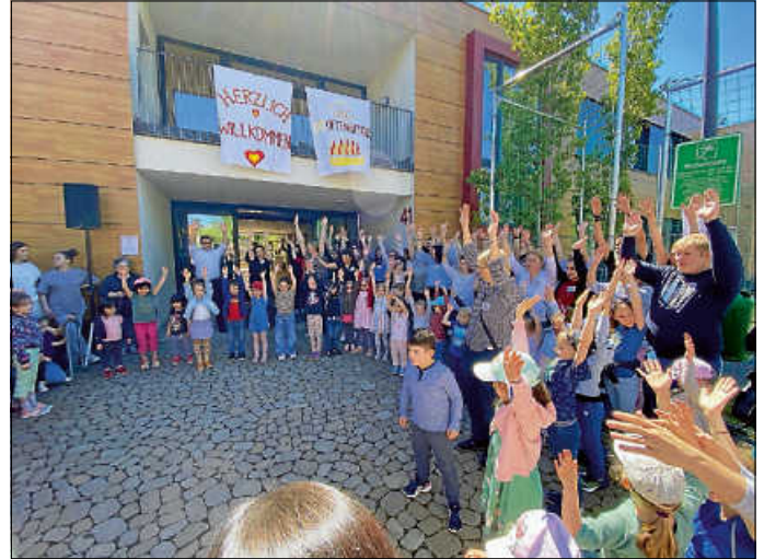
Am 27. April feierte das Kinderhaus Hutwiesen sein 10-jähriges Bestehen.

Getümmel. Vieles war an diesem Tag geboten. Über die ganze Einrichtung verteilten sich verschiedene Angebote und Stationen rund um das Thema Bewegung. Barfußparcours, eine Fotowand, eine Bewegungslandschaft, Parcours mit Fahrzeugen, Tänzen und Yogaangebote ließen keine Langeweile aufkommen. Und wer zwischendurch mal etwas Entspannung und ruhigere Augenblicke suchte, konnte dies bei Lichterspielen oder auch in einem Lichtertunnel tun.