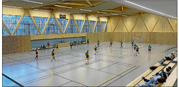
Lures neuestes abgeschlossenes Projekt: die Sporthalle Alice Milliat

Empfangen wurde die Delegation im Rathaus von Lure. Auf dem umfangreichen Programm stand am Samstag neben dem Besuch des historischen Museums in Luxeuil Le Bains auch die Besichtigung der neuen Sporthalle Alice Milliat. Am Sonntagmorgen besichtigte ein Teil der Delegation dann die städtische Bücherei. Dieser Besuch diente vor allem dem neuesten geplanten Projekt mit den französischen Freunden. Neben den beiden Gemeinderäten, den Verwaltungen und zahlreichen Asperger und Lurer Vereinen möchten auch die beiden Büchereien künftig gemeinsame Projekte auf die Beine stellen. Erste Kontakte hierfür wurden schon einmal geknüpft.