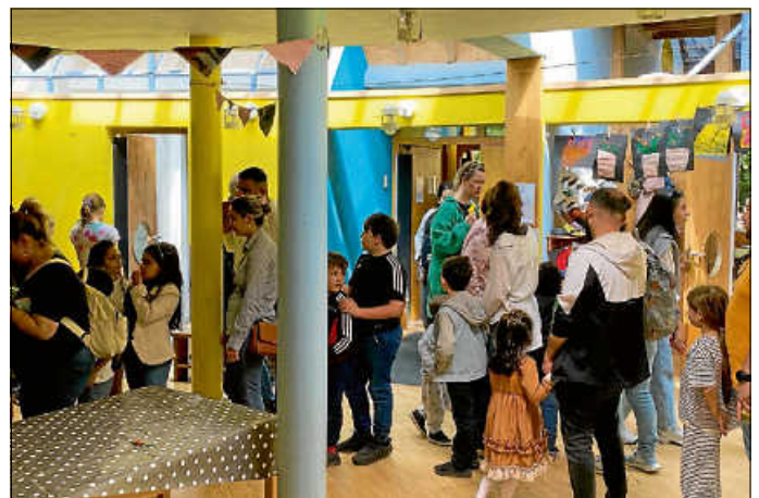
Doppeljubiläum am 4. Mai: 30 Jahre Kindergarten Wilhelmstraße und 20 Jahre Kindergarten Schubartschule

Gleich ein doppeltes Jubiläum konnte am 4. Mai der Kindergarten Wilhelmstraße / Schubartschule feiern. Genauer gesagt 30 Jahre Kindergarten Wilhelmstraße und 20 Jahre Kindergarten Schubartschule. Gleich zwei Gründe also zum Feiern. Und genau dies tat der Kindergarten auch kräftig mit einem Tag der offenen Tür. Dabei konnten nicht nur die Räume besichtigt und der Austausch mit dem pädagogischen Personal der Einrichtung gesucht werden, auch ansonsten war etliches an diesem besonderen Doppeljubiläum geboten. Während sich die großen Besucher einen Eindruck von der Einrichtung machen konnten, sorgte ein umfangreiches Programm dafür, dass auch bei den kleinen Besuchern keine Langeweile aufkam. Konnte man doch Buttons basteln, sein Glück an einem Glücksrad versuchen oder auch mit ordentlich Schwung versuchen, möglichst viele Dosen beim Dosenwerfen abzuräumen. Wer mehr über die Errichtung erfahren wollte, konnte die vergangenen Jahrzehnte auch anhand einer kleinen Ausstellung mit Berichten, Artikeln und Fotos Revue passieren lassen und so tief in die Geschichte und Entwicklung der Kindertagesstätte eintauchen.