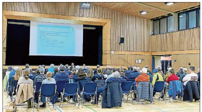
Eine Vorstellung des Entwurfs des Bebauungsplans für die neue Sporthalle am Schulzentrum fand am 13. November in der Stadthalle statt.

Am Mittwoch, den 13. November, fand eine detaillierte Vorstellung des Entwurfs des Bebauungsplans für die neue Sporthalle am Schulzentrum statt. Vorgestellt wurden die Planungen durch Frau Bockhacker vom Büro Project GmbH aus Esslingen sowie Vertretern der Stadtverwaltung. Fast 60 Teilnehmende, darunter auch Gemeinderäte, nahmen an der Veranstaltung teil und konnten in einem regen Austausch viele Fragen beantwortet bekommen.