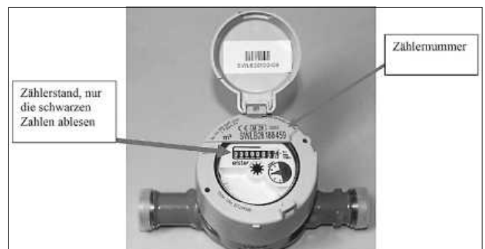
Muster eines Wasserzählers

Bitte beachten Sie, dass Nachkommastellen nicht anzugeben sind, d. h. bitte nur die schwarzen Zahlen ablesen. Sie vermeiden durch die Ablesung, dass Ihr Wasserverbrauch von uns geschätzt werden muss.