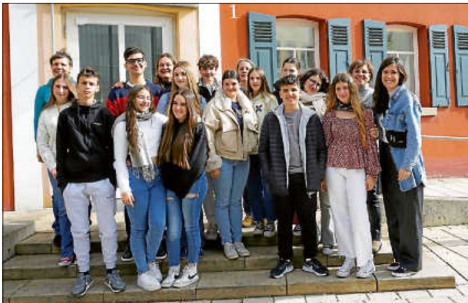
Am 16. April durfte die Stadtverwaltung im Rahmen eines Schüleraustauschs des Friedrich-List-Gymnasiums Schülerinnen und Schüler des Colegio La Presentación in Granada auf dem Rathaus begrüßen.

Am 16. April durfte die Stadtverwaltung Schülerinnen und Schüler aus Spanien auf dem Rathaus begrüßen. Genauer gesagt, Schülerinnen und Schüler des Colegio La Presentación in Granada. Bereits seit ein paar Jahren besteht eine feste Partnerschaft des Friedrich-List-Gymnasiums mit der Schule in Granada. Dennoch ist es die jüngste Kooperation des Friedrich-List-Gymnasiums auf europäischer Ebene. Entstanden ist sie im Rahmen des Programms Erasmus+ der Europäischen Union. Wie alle anderen Verbindungen ins europäische Ausland steht auch dieser Austausch des Friedrich-List-Gymnasiums unter dem Motto „Europa stärken“. Bei ihrem Besuch auf dem Rathaus erhielten die Schülerinnen und Schüler, gemeinsam mit ihren drei Begleitlehrerinnen, einen Überblick über Asperg, die Geschichte der Stadt sowie die Arbeit des Gemeinderates und der Stadtverwaltung.