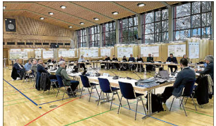
Am 1. Februar fand die Preisgerichtssitzung des von September 2023 bis November 2023 durchgeführten Architektenwettbewerbs für den Neubau der Sporthalle beim Schulzentrum statt.

Am 1. Februar fand die Preisgerichtssitzung des von September 2023 bis November 2023 durchgeführten Architektenwettbewerbs für den Neubau der Sporthalle beim Schulzentrum statt. Dabei wurden durch ein Preisgerichtsgremium, welchem neben erfahrenen Architekten und Landschaftsarchitekten auch Mitglieder des Gemeinderates sowie Vertreter des TSV Asperg und des SB Asperg angehörten, die Preisträger ermittelt. Insgesamt haben sich 6 gesetzte und 19 durch Los ermittelte Architekturbüros am Wettbewerb beteiligt. Nach einer ausführlichen und informativen Vorstellung aller 25 abgegebenen Arbeiten durch das mit der Abwicklung beauftragte Architekturbüro kohler grohe architekten aus Stuttgart, wurden im Anschluss daran in drei Durchgängen fünf Arbeiten in die engere Wahl genommen. Aus diesen fünf in die engere Auswahl genommenen Entwürfen wurden am Ende eines ereignisreichen Tages dann einstimmig die Preise eins bis drei sowie zwei Anerkennungen ermittelt.