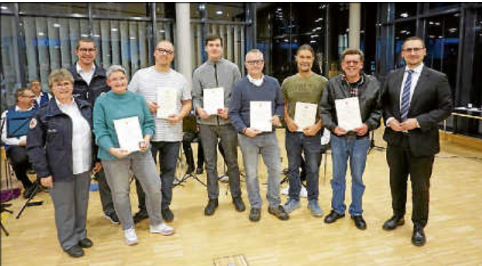
Und auch Blutspenderinnen und Blutspender wurden beim Ehrenamtsabend geehrt.

Bei der anschließenden Blutspenderehrung konnte Bürgermeister Christian Eiberger weitere Asperger Bürgerinnen und Bürger ehren, die über viele Jahre Blut gespendet haben.