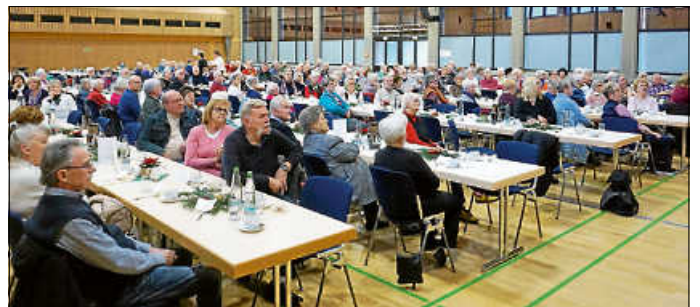
Auch die städtische Seniorenweihnachtsfeier am 3. Dezember fand wieder regen Zuspruch.

Rund 150 Seniorinnen und Senioren sind am Dienstag, 3. Dezember, der Einladung von Stadtverwaltung und Gemeinderat zur städtischen Seniorenweihnachtsfeier in die Stadthalle gefolgt. Bürgermeister Christian Eiberger zeigte sich sehr erfreut über diesen Zuspruch. Bestätigte er doch, welch hohen Stellenwert die Feier für viele Seniorinnen und Senioren habe und dass sie einen festen Bestandteil im gesellschaftlichen Leben vieler Asperger Bürgerinnen und Bürger darstelle. Umrahmt wurde die Eröffnung und Begrüßung erstmals durch den Unterstufenchor der Klassen 5 und 6 des Friedrich-List-Gymnasiums. Mit Weihnachtsliedern stimmten die fast 50 jungen Sängerinnen und Sänger die Seniorinnen und Senioren unter großem Beifall auf die anstehende Weihnachtszeit ein. Nach Kaffee und Kuchen war es dann die Schwabenbühne, welche die Seniorinnen und Senioren im Anschluss mit mehreren unterhaltsamen Sketchen aus dem Alltags- und langjährigen Eheleben zum Schmunzeln und Lachen brachte.