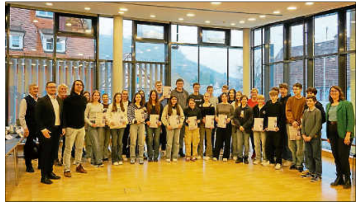
Abschluss des Planspiels Kommunalpolitik am 6. März im Keltensaal

Fraktionen. Am letzten Projekttag wurde dann abschließend eine Gemeinderatssitzung im Keltensaal nachgespielt, zu welcher auch Bürgermeister Christian Eiberger hinzukam, um, genau wie im richtigen Gemeinderat, die Rolle des Vorsitzenden einzunehmen.