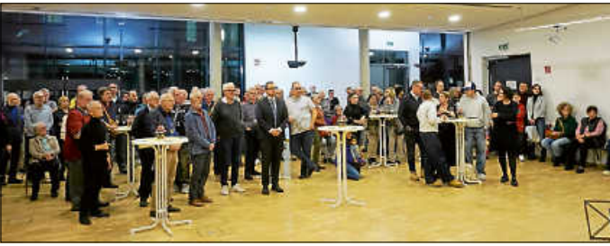
Am 2. Dezember luden Gemeinderat und Stadtverwaltung alle für die Stadt ehrenamtlich Tätigen in die Stadthalle ein.

Im Rahmen des städtischen Ehrenamtsabends fanden auch wieder die Ehrungen erfolgreicher Sportlerinnen und Sportler der vergangenen Sportsaison sowie die Blutspenderehrung statt.