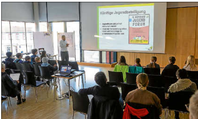
Am Freitag, 6. Dezember fand das zweite Asperger Jugendforum statt.