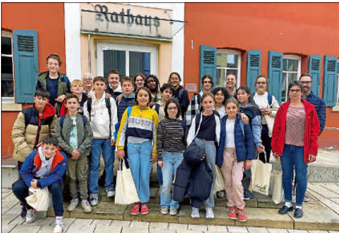
Am 9. Oktober durfte die Stadtverwaltung im Rahmen eines Schüleraustauschs des Friedrich-List-Gymnasiums Schülerinnen und Schüler des Collège Notre-Dame aus La Montagne bei Nantes auf dem Rathaus begrüßen.