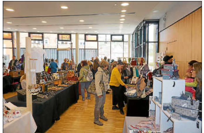
Fester Bestandteil der Kirbe war auch im vergangenen Jahr wieder der Hobbykunstmarkt im Keltensaal.

Marktstände, der Vergnügungspark für Kinder auf dem Wilhelmsplatz und der Flohmarkt boten großen und kleinen Besuchern ein abwechslungsreiches Angebot an Essen und Verkaufswaren. Auch die auf dem Marktplatz stattgefundene Kinderkirbe stieß wieder auf sehr großes Interesse. Ab mittags öffneten die Einzelhändler zum verkaufsoffenen Sonntag ihre Türen, und auch der Hobbykunstmarkt im Keltensaal konnte wieder zahlreiche Besucher locken.