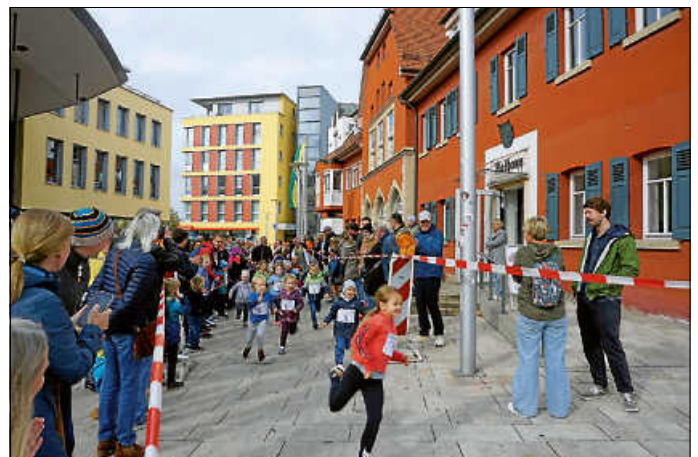
Und auch der Kirbelauf „Rund ums Rathaus“ durfte bei der Asperger Kirbe natürlich nicht fehlen.

Als fester Bestandteil der Kirbe galt auch im vergangenen Jahr wieder die Fotoausstellung der Blende 81. Es gab auch wieder den Kirbelauf, der rund ums Rathaus stattfand, und auch die Wengerter beteiligten sich wieder mit ihrem Kelterbetrieb.