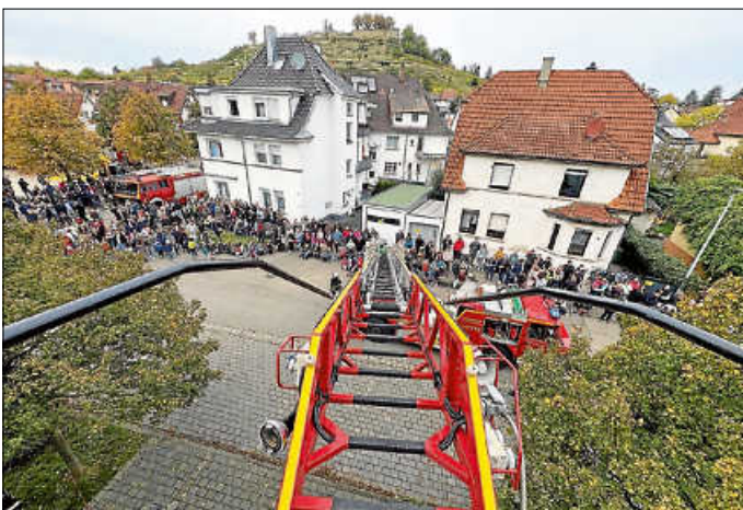
Mehrere Hundert Besucher nahmen am 19. Oktober an der Jahreshauptübung der Feuerwehr teil.