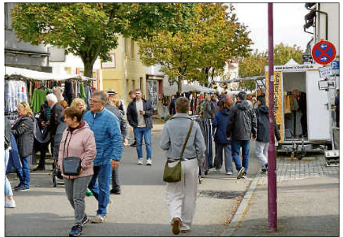
Der Kirbemarkt sowie zahlreiche weitere Attraktionen lockten am 6. Oktober wieder Besucher aus nah und fern in die Stadtmitte und die Bahnhofstraße.

Traditionell zum Erntedankfest am ersten Sonntag im Oktober fand am 6. Oktober auch wieder die Asperger Kirbe statt. Der Wettergott meinte es dabei erneut ganz besonders gut mit den Aspergern und ihren zahlreichen Besuchern aus nah und fern. Der Himmel blieb trocken, und im Laufe des Tages kam sogar die Sonne hindurch. So war es auch nicht verwunderlich, dass die Angebote in der Stadtmitte und der Bahnhofstraße wieder sehr gut besucht waren. Tausende besuchten die zahlreichen Angebote in der Stadtmitte und der Bahnhofstraße.