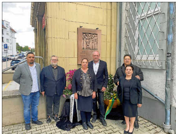
Gedenken an die Deportation der Sinti und Roma am 18. Mai