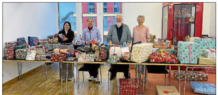
Und auch die Weihnachtswunschbaumaktion war 2024 wieder ein toller Erfolg.

Nach dem erfolgreichen Start 2022 konnte auch die Weihnachtswunschbaum-Aktion 2024 bereits zum dritten Mal erfolgreich und unter bewährter Kooperation der Asperger Kirchengemeinden mit der Stadtverwaltung durchgeführt werden. Weit über 100 Kindern und Erwachsenen, die finanziell benachteiligt sind oder einen schweren Schicksalsschlag erleiden mussten, konnte somit wieder ein schönes Weihnachtsfest mit Geschenken ermöglicht werden. Die meisten der Weihnachtsgütern wurden von Asperger Bürgerinnen und Bürgern übernommen und die Geschenke besorgt. Die weiteren Wünsche wurden von freiwilligen Helfern der Kirchengemeinden organisiert und mit eigens hierfür abgegebenen Spenden finanziert. Viele Asperger Bürgerinnen und Bürger haben ihren Mitbürgern somit zu Weihnachten wieder ein kleines oder auch großes Lächeln ins Gesicht gezaubert.