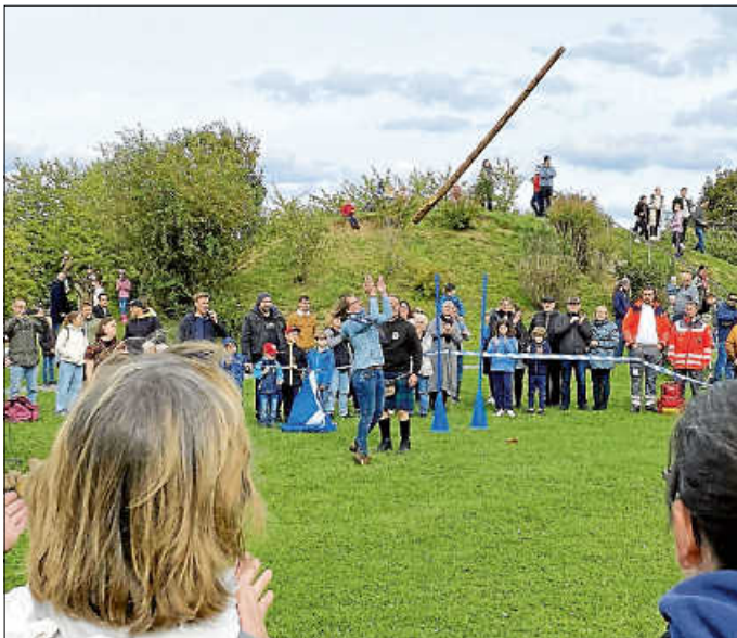
Weit hinaus wurden auch wieder die Baumstämme geworfen.

Die Wettkämpfe für alle – ob Kind oder Erwachsener – fanden dann am Sonntag statt. Startschuss machte das traditionelle Entenrennen und die Eröffnung der Mini-Highlandgames. Gleichzeitig konnten sich die Besucher über „Nils den Gaukler“ freuen oder bei den „Edlen von Buron“ gegen einen Drachen kämpfen. Wer sich für schottische Folkloretänze interessierte, kam in der Stadthalle voll auf seine Kosten. Dort zeigte die Asperger Tanzbühne „Dance Stage“ Volkstänze aus dem Herkunftsland der Highlandgames. Um 14.00 Uhr schließlich bahnte sich die Highlandparade mit den Heidelberg and District Pipes and Drums ihren Weg durch den Bürgergarten und versetzte spätestens zu diesem Zeitpunkt alle Besucherinnen und Besucher in die schottischen Highlands. Und auch an den Heavy Events im Anschluss nahmen wieder zahlreiche Erwachsene teil und wetteiferten beim Baumstammwerfen, dem Farmers Walk, dem Steinestoßen und dem Hufeisenzielwurf um die vorderen Plätze.