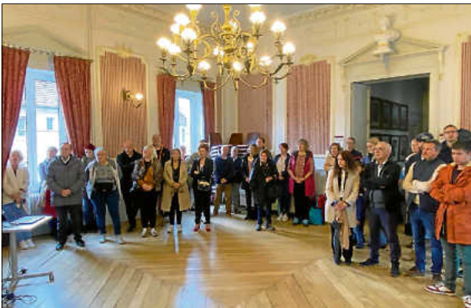
Ende September reiste eine 20-köpfige Delegation in die französische Partnerstadt Lure.

Das letzte Septemberwochenende stand ganz im Zeichen der deutsch-französischen Freundschaft. Bereits seit 1967 besteht die Städtepartnerschaft mit Lure und mindestens einmal jährlich findet auch ein Austausch zwischen den beiden Gemeinderäten statt. Vergangenes Jahr wieder in Lure. Am Samstag, 28. September reiste eine 20-köpfige Asperger Delegation zu einem zweitägigen Treffen in die Partnerstadt.