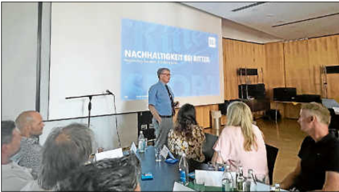
Am 8. Juli veranstaltete die Stadtverwaltung im Keltensaal ein Unternehmensvesper.