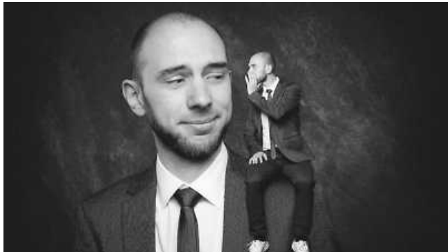
Zauberkunst mit Felix Fischer.

Sonntag, 12.01. – 19.00 Uhr – Eintritt: € 16,-